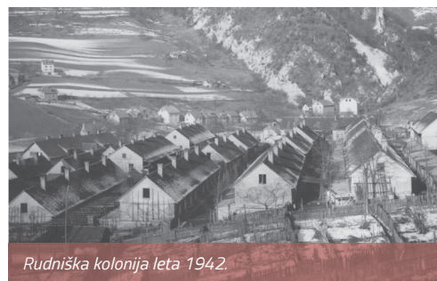
Rudniška kolonija leta 1942.

Zametki rudniške kolonije v Hrastniku (od leta 1963 Ulica prvoborcev) segajo v leto 1875, ko je rudnik na levi strani Bobna zgradil tri enonadstropne in šest pritličnih hiš z različnim številom stanovanj (od enega pa vse do osemnajst).