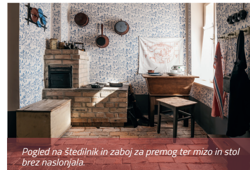
Pogled na štedilnik in zaboj za premog ter mizo in stol brez naslonjala.

Najpomembnejši del kuhinjske opreme je bil vzidan štedilnik – špuorhet (nemško Sparherd, ekonomična peč) z urejenim odvodom dima v zidan dimnik. Štedilniki so sredi 19. stoletja začeli prevzemati funkcijo odprtih ognjišč in peči. Uporabljali so se za ogrevanje stanovanj, pripravo hrane, sušenje in shranjevanje drv. Za shranjevanje premoga je stal poleg štedilnika zaboj za premog – kuolnkišta (nemško Kohlenkiste/skrinja za premog), ki so ga uporabljali tudi za sedenje.