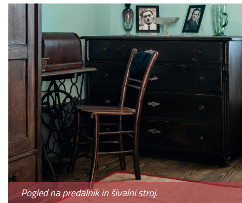
Pogled na predalnik in šivalni stroj.

Redek, a dragocen kos opreme v spalnici je bil šivalni stroj – sing'rca . Gospodinjam je omogočal, da so šivale za potrebe svoje družine, še raje pa za sosede, in tako zagotovile dodaten priliv denarja v družinski proračun, ki je bil pri večini vezan samo na možovo plačo.