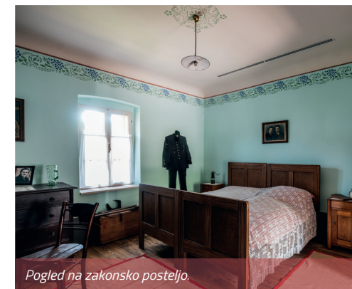
Pogled na zakonsko posteljo.

Osnovni del opreme v sobi je bila postelja – puojstla . Vse do druge svetovne vojne so bile ne glede na število družinskih članov (v povprečju več kot pet) v uporabi povprečno tri (poleg zakonske še izvlečna), zato sta v eni postelji običajno spala najmanj dva družinska člana, najmlajši pa so spali v košarah ali zibelkah.