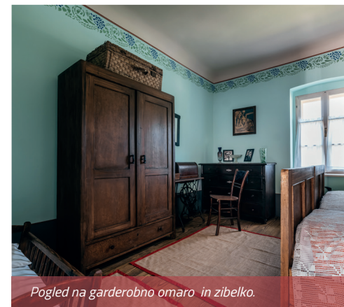
Pogled na garderobno omaro in zibelko.

Za shranjevanje spodnjega perila, posteljnine in srajc (v zgornjem predalu tudi dokumentov) so uporabljali predalnik – kumuodo (nemško Kommode/predalnik).