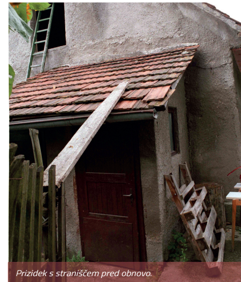
Prizidek s straniščem pred obnovo.

Na zadnji strani hiš, pod sobnimi okni, so bile dozidane drvarnice – b'rake . Vsaki družini je pripadala ena. V njej so hranili kurjavo (pregom in drva) in orodja za obdelavo vrta – grjede .