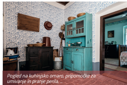
Pogled na kuhinjsko omaro, pripomočke za umivanje in pranje perila, ...

Naslednji pomemben del opreme je bila miza – mj'trga (nemško Mehl Truhe/skrinja za moko), ob kateri se je vsaj trikrat dnevno pri skupnih obrokih zbirala družina. Poleg tega so v delu mize, imenovanem korito, hranili vrečo z moko ali mesili testo za kruh, ki so ga pekli v krušni peči. Miza je bila običajno postavljena med vrata in okno, poleg nje ob steni je bila klop, nasproti pa vsaj dva stola brez naslonjala – štokrla (nemško Hocker/stolček). Stol je služil za sedenje in tudi kot podstavek pri umivanju (v prenosnem umivalniku – l'vuorju ) in pri mescenju testa (v krušni skledi).