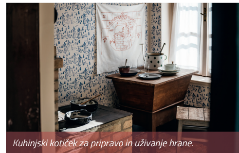
Kuhinjski kotiček za pripravo in uživanje hrane.

Naslednji pomemben del opreme je bila miza – mj'trga (nemško Mehl Truhe/skrinja za moko), ob kateri se je vsaj trikrat dnevno pri skupnih obrokih zbirala družina. Poleg tega so v delu mize, imenovanem korito, hranili vrečo z moko ali mesili testo za kruh, ki so ga pekli v krušni peči. Miza je bila običajno postavljena med vrata in okno, poleg nje ob steni je bila klop, nasproti pa vsaj dva stola brez naslonjala – štokrla (nemško Hocker/stolček). Stol je služil za sedenje in tudi kot podstavek pri umivanju (v prenosnem umivalniku – l'vuorju ) in pri mescenju testa (v krušni skledi).